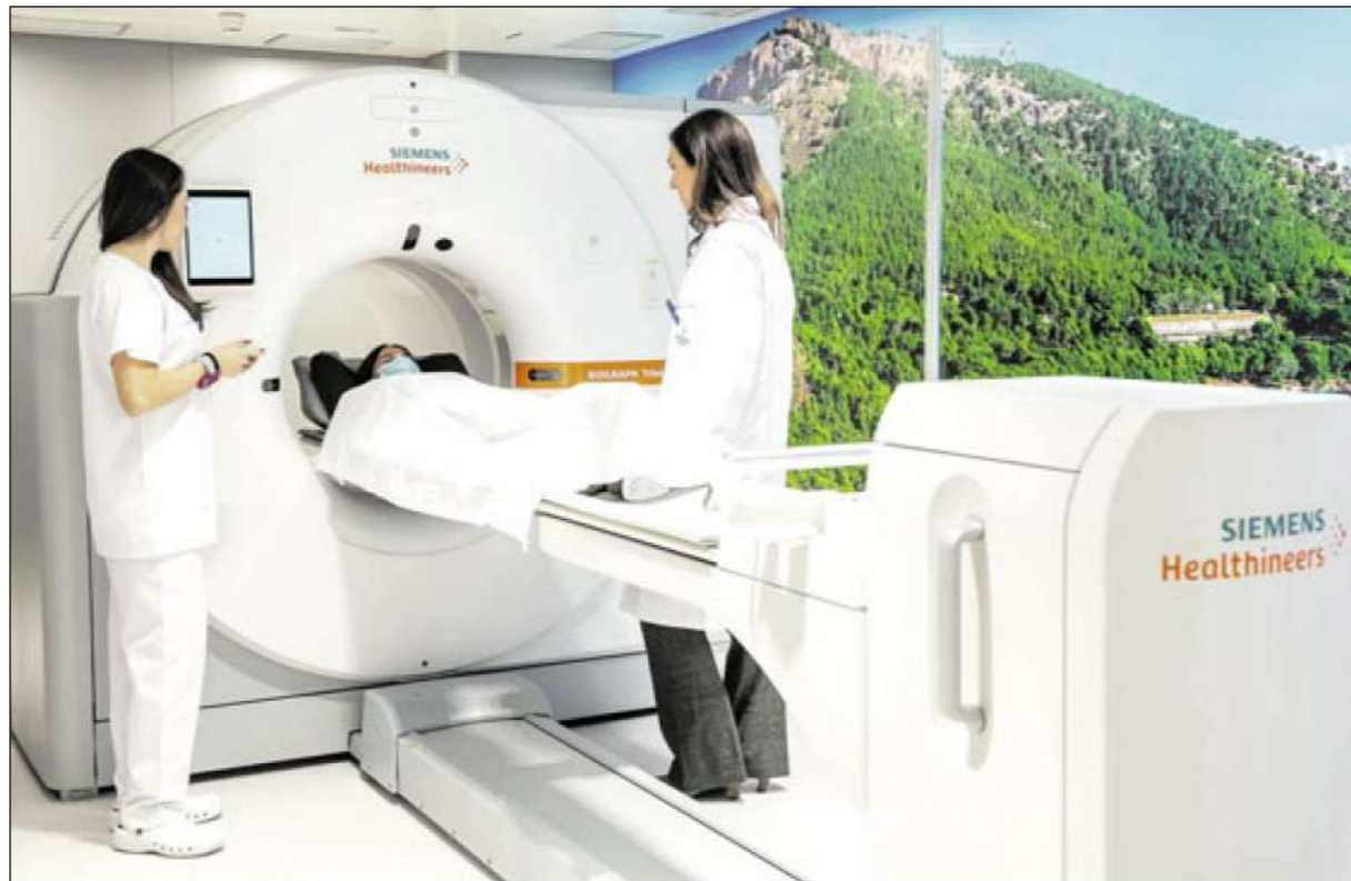
PETTC digital de Clínica Rotger.

La Unidad de Cirugía Robótica compartida por Clínica Rotger y Hospital Quirónsalud Palmplanas constituyó el primer programa de cirugía robótica privada de Baleares. Actualmente, ha superado ya las