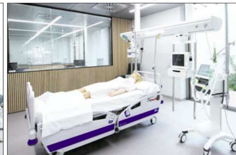
Equipamiento tecnológico para la formación de alumnos de la escuela de enfermería CESAG - Quirónsalud.