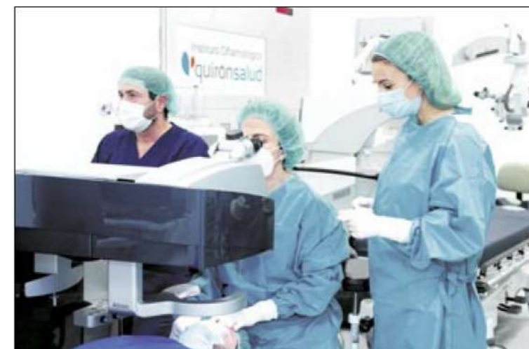
Tecnología avanzada en el Instituto Oftalmológico de Hospital Quirónsalud Palmplanas.

► El equipo de PET-TC digital, la Resonancia Magnética de 3T, el TAC de 128 cortes, el equipo de Cirugía Robótica, la nueva Litotricia avanzada son equipos de tecnología puntera que permiten ofrecer las mejores alternativas de diagnóstico y tratamiento al paciente