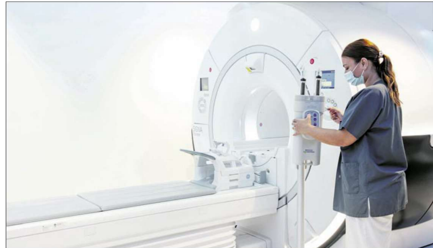
Resonancia Magnética 3 Teslas Hospital Quirónsalud Palmplanas.

► El Índice de Excelencia Hospitalaria publicado recientemente sitúa nuevamente a Clínica Rotger y Hospital Quirónsalud Palmplanas como los mejores hospitales privados de las Islas Baleares