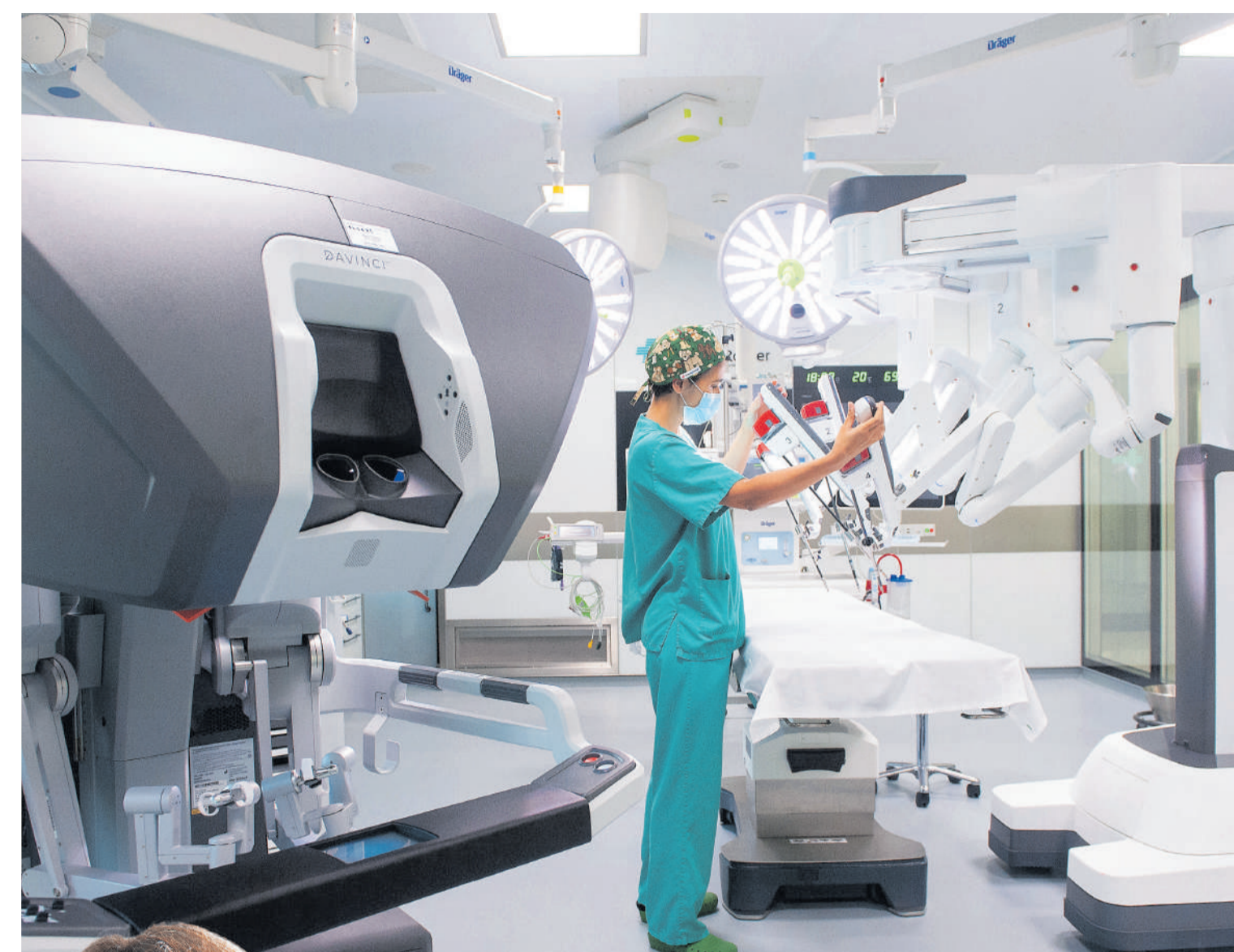
El robot da Vinci Xi ofrece las mejores condiciones de visibilidad y una mayor precisión.

La Unidad de Urología Robótica de Clínica Rotger y Hospital Quirónsalud Palmplanas ofrece a todos los pacientes interesados la posibilidad de solicitar cita o consultar una segunda opinión con su equipo de especialistas que le explicarán pormenorizadamente las ventajas de la intervención con ayuda robótica.