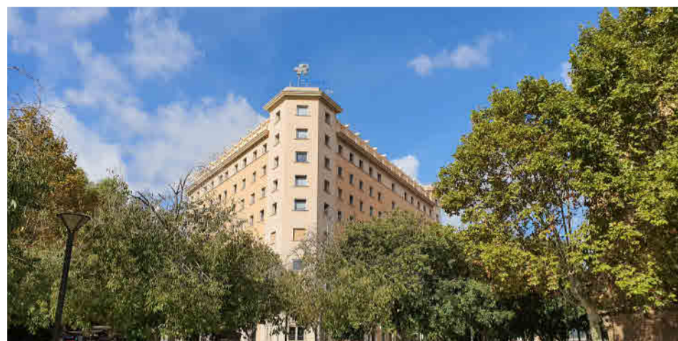
Fachada Clínica Rotger.