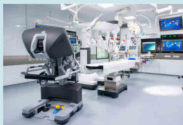
El Robot Da Vinci Xi en la Clínica Rotger.