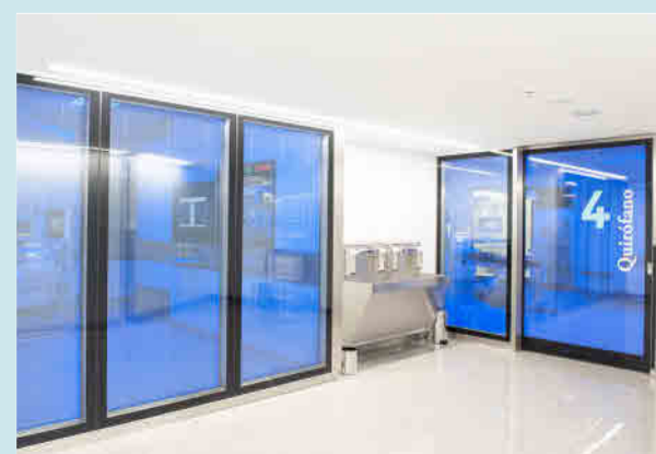
Quirófanos de alta complejidad en Clínica Rotger.

sin ingreso, con boxes individuales para la monitorización y recuperación del paciente, un quirófano de cesáreas, 2 Salas de Endoscopia y una Unidad de Obstetricia que destaca por su Plan de Parto respetado, por el acompañamiento durante el trabajo de parto, por la experiencia sensorial o por las medidas de seguridad que ofrece la Unidad. En este sentido, cuenta con una sala de reanimación para la madre y el bebé y un quirófano exclusivo de cesáreas, in situ, junto a los partitorios.