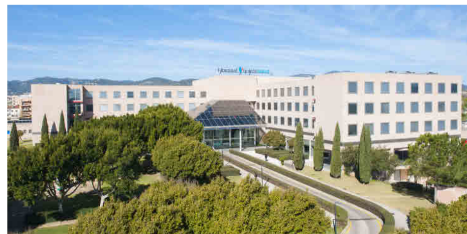
Fachada Hospital Quirónsalud Palmaplanas.