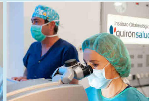
Equipamiento tecnológico del Instituto Oftalmológico Quirónsalud Palmaplanas.