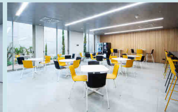
Espacio Quirónsalud para el estudio en el Centro de Formación de la Escuela de Enfermería.