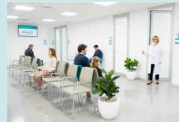
Sala de Espera del Instituto Oftalmológico Quirónsalud Palmaplanas.

El Instituto Oftalmológico inicio su actividad a principios de 2022 y cuenta con especialistas de referencia y tecnología avanzada en algunos equipos exclusivos en oftalmología en Baleares.