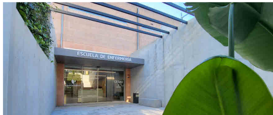
Escuela de Enfermería.

durante los últimos años y que en este último ejercicio destaca por la renovación de infraestructuras: 10 nuevos quirófanos y 5 partitorios en el Área Quirúrgica de Clínica Rotger, así como un nuevo Instituto Oftalmológico en el Hospital Quirónsalud Palmaplanas, la incorporación de nuevos equipos médicos y nueva tecnología médica para el diagnóstico y el tratamiento, como el primer equipo de Cirugía Robótica, Da Vinci Xi y un nuevo TAC de 128 cortes en Clínica Rotger, o una nueva Resonancia Magnética de 3 teslas en el Hospital Quirónsalud Palmaplanas.