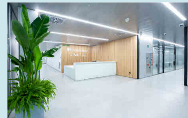
Centro de Formación de la Escuela de Enfermería Quirónsalud Baleares

las sesiones prácticas en el nuevo Centro de Formación, ubicado junto al Hospital Quirónsalud Palmaplanas.