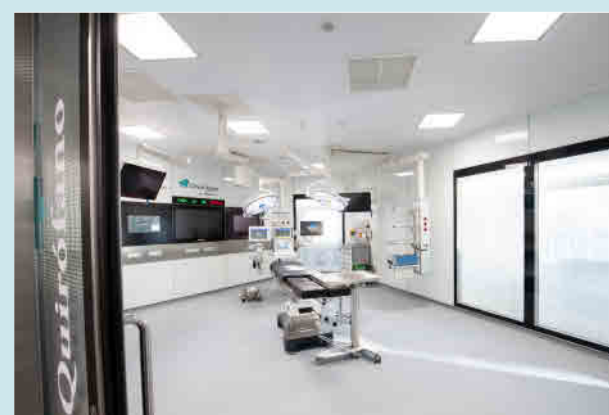
Área Quirúrgica de Clínica Rotger.