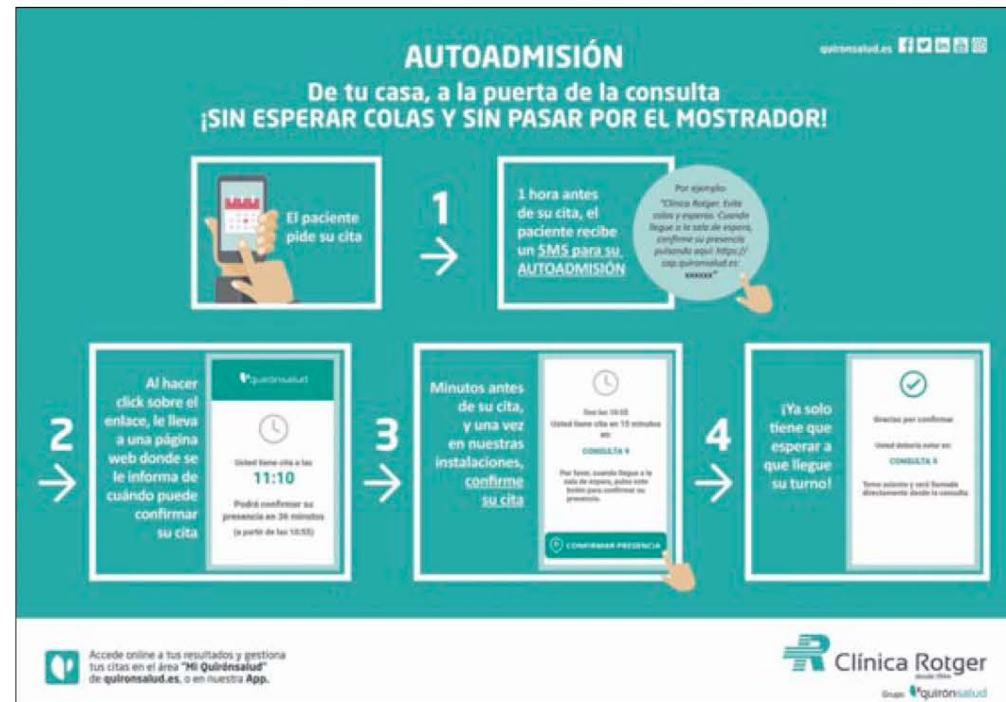
Procedimiento para la autoadmisión digital en Clínica Rotger.

desde su teléfono, le permite acceder al servicio de autoadmisión. En esa misma pantalla