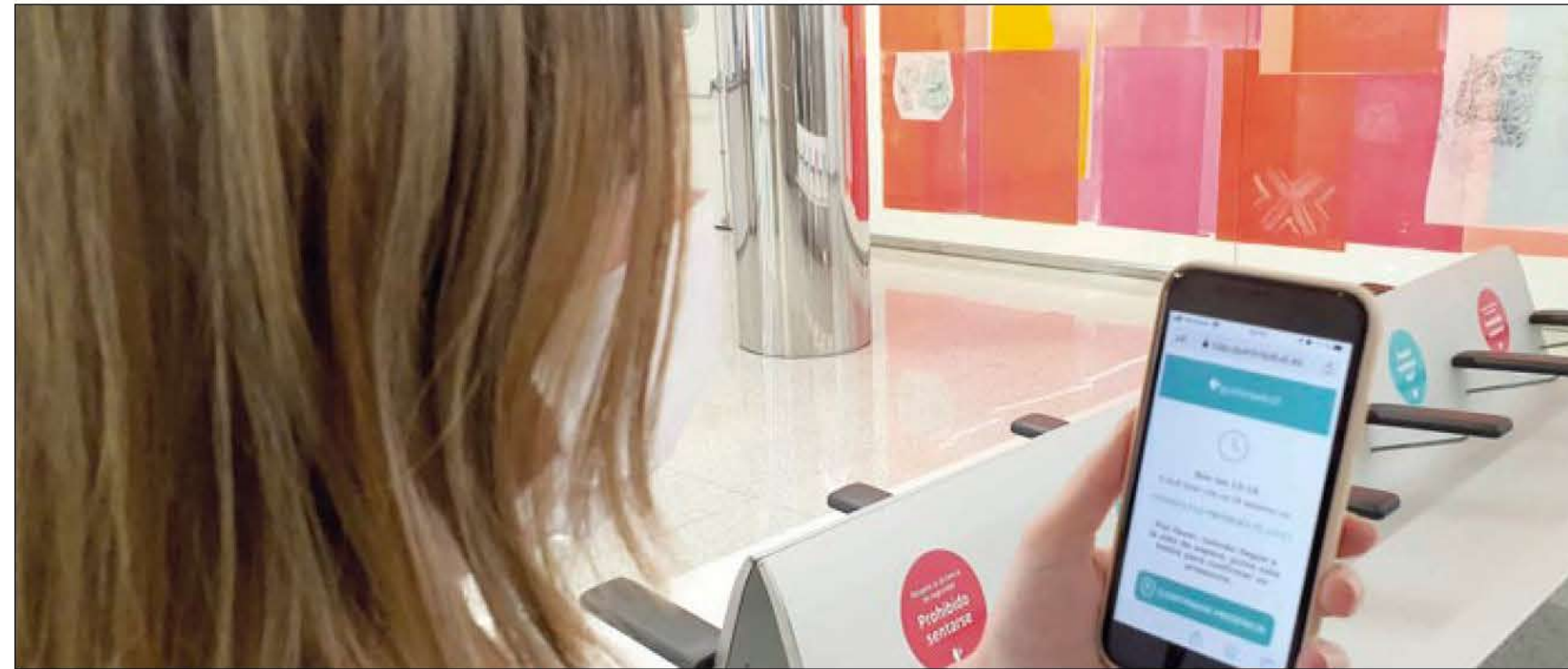
Quirónsalud en Baleares dispone de un sistema para la admisión en consultas directamente desde el teléfono.