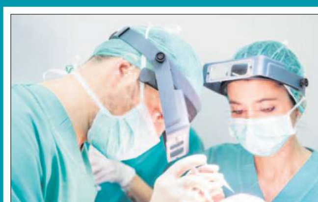
Intervención de implante capilar.

Clinica Rotger Via Roma, 3 ☎ 971 44 85 00 🌐 www.clinicarotger.com