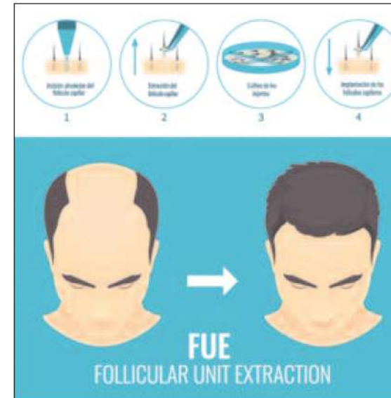
Infografía implante capilar.

■ Una vez extraídos los injertos, se preparan en el microscopio y mediante incisiones precisas en la zona deseada, se implantan las unidades foliculares previamente extraídas, junto con estructuras perifoliculares, vasos capilares y glándula sebácea. En este paso, es funda-